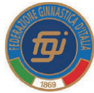
FEDERAZIONE GINNASTICA D'ITALIA