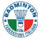
FEDERAZIONE ITALIANA BADMINTON